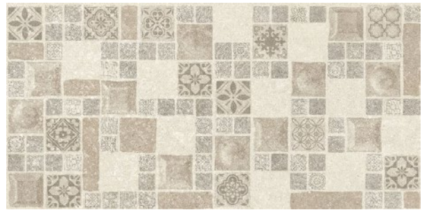
Urano Stein Ivory

- Pavimento de patios y terrazas: Gres porcelánico 33x33. Modelo Dover antislip Grey. Fabricante: Newker. Clic en la imagen para más info.