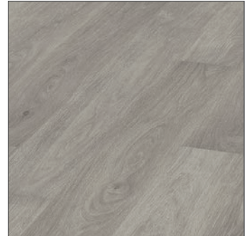
GOLD LAMINATE PRO 711 ROBLE FRAGATA