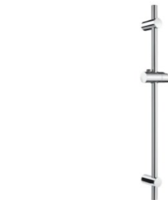
BARRA DE DUCHA 700 mm con soporte regulable en altura. Clic en la imagen para más info.