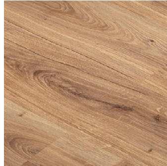
GOLD LAMINATE PRO 705 ROBLE VINTAGE MATE