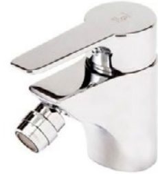
GRIFO LAVABO Y BIDÉ Galindo - Ingo Plus. Grifo mono- mando para instalación en repisa. Clic en la imagen para más info.