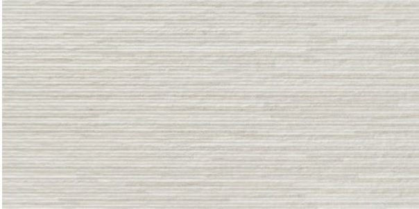
Urano Linear Silver

- Paño decorado de baños: Revestimiento de pasta blanca rectificada 30x60. Modelo Urano Linear o Urano Stein. Colores: Silver o Ivory. Fabricante: Benadresa. Clic en la imagen para más info.