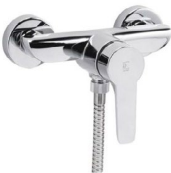
GRIFO PLATO DE DUCHA O BAÑERA GALINDO - Ingo Plus. Grifo monomando ducha o baño / ducha para instalación mural + sopor- te + maneral. Clic en la imagen para más info.