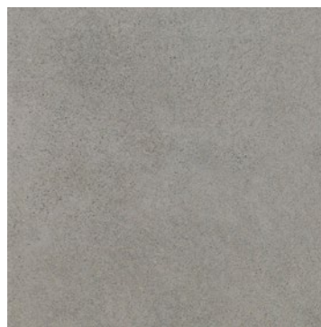
Dover antislip Grey

- Pavimento de patios y terrazas: Gres porcelánico 33x33. Modelo Dover antislip Grey. Fabricante: Newker. Clic en la imagen para más info.