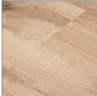
GOLD LAMINATE PRO 703 ROBLE CRUDO ACEITADO