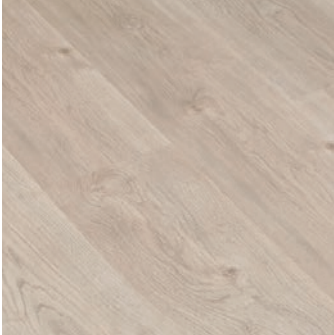
GOLD LAMINATE PRO 701 ROBLE PURE

Colección GOLD LAMINATE PRO o similar. A elegir entre los siguientes modelos (clic en la imagen para más info):