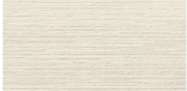
Urano Linear Ivory