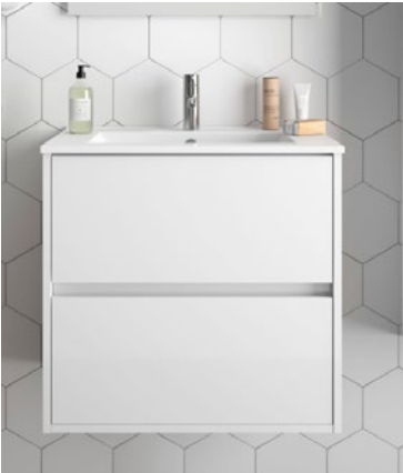
LAVABO Y MUEBLE BAJO Baño 2. SALGAR - Noja. 60/80 cm (en los bajos de 80 cm y en los áticos de 60 cm). Clic en la imagen para más info.