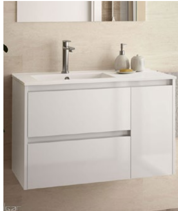
LAVABO Y MUEBLE BAJO Baño 1. SALGAR - Noja. 85,5 cm. Clic en la imagen para más info.