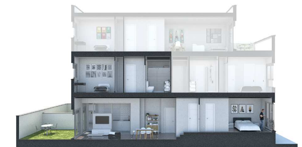
SECCIÓN 2 - BAJO B