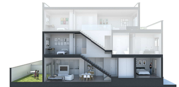
SECCIÓN 1 - BAJO B

SUPERFICIE ÚTIL INTERIOR 84.80 m 2 SUPERFICIE PATIO EXTERIOR 19.25 m 2