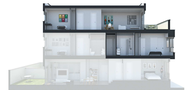
SECCIÓN 2 - PRIMERO B