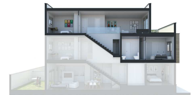
SECCIÓN 1 - PRIMERO B

SUPERFICIE ÚTIL INTERIOR 79.77 m 2 SUPERFICIE TERRAZA 12.99 m 2